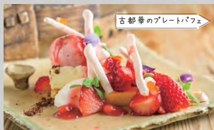
古都華のプレートパフェ

【住 所】平群町平等寺 73-3 【TEL】070-9095-0674 【定休日】火曜日 【営業時間】10:30 ~ 16:00