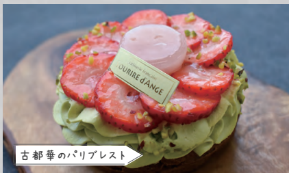
古都華のバリアレスト

【住 所】平群町緑ヶ丘 6 丁目 15-22 【TEL】0745-60-5101 【定休日】水曜日 【営業時間】10:00 ~ 19:00