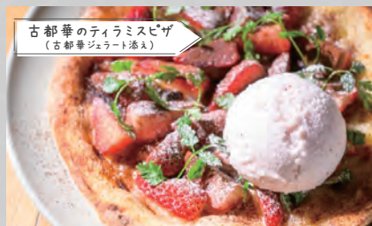
古都華のティラミスビザ (古都華ジェラート添え)

【住 所】平群町信貴山 2303-3 【TEL】0745-51-0149 【定休日】火曜日、水曜日、木曜日、金曜日 ※イベント期間中は営業します 【営業時間】12:00 ~ 17:00