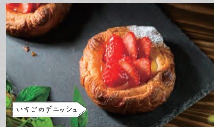
いちごのデニッシュ

【住 所】平群町信貴山 2303-6 【TEL】080-9165-0368 【定休日】月曜日、火曜日 (不定休) 【営業時間】10:00 ~ 17:00