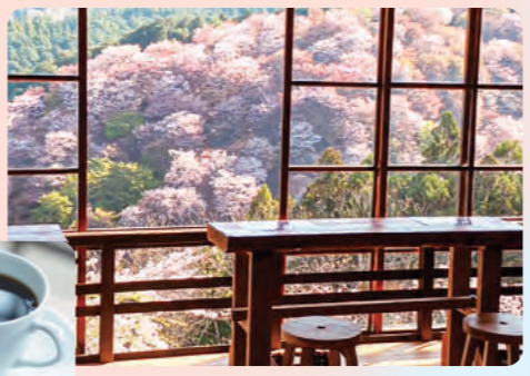
自家焙煎のコーヒー