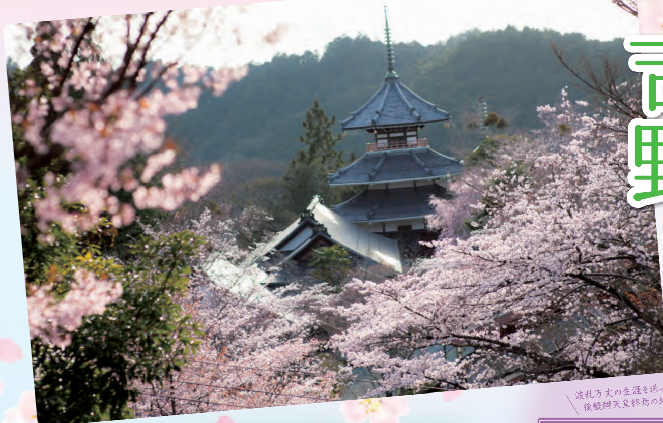
波乱万丈の生涯を送った後醍醐天皇終焉の地

日本屈指の桜の名所は、春の訪れとともに麓からゆっくと桜色に染め上がっていきます。「中千本エリア」は、一目千本と称される絶景をはじめグルメや見どころが充実。さあ、桜の吉野山で素敵な休日をお過ごしください。