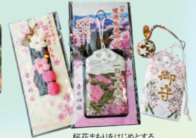
桜花まもりをはじめとする桜がデザインされた授与品