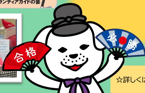
王寺町公式マスコットキャラクター 聖徳太子の愛犬 雪丸