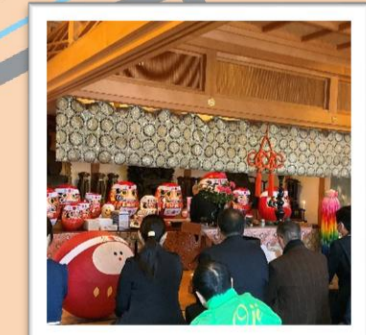
合格だるまストリートのだるまさんはすべてご祈祷いただいています